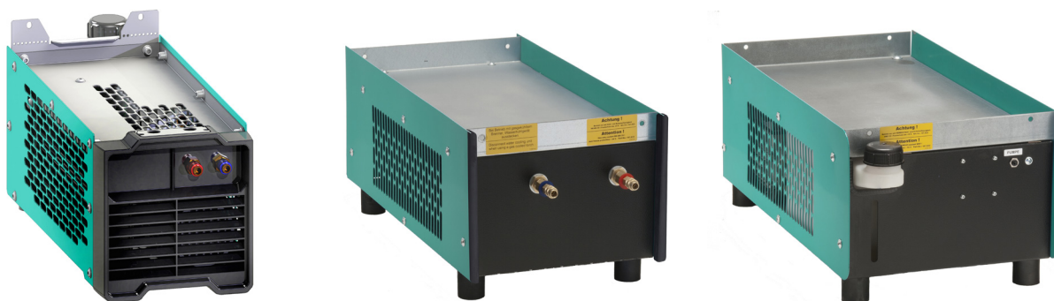
Abb. C - 1 WK 210 / WK 300 / WK 325